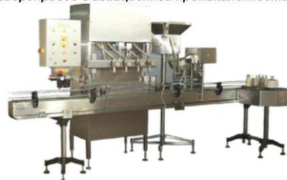
Автоматизированная линия с пневмоприводом

связана также с углубленным изучением автоматизированного оборудования энергомашиностроения и нефтегазовой промышленности, мобильной техники, наземного и воздушного транспорта, энергетики.