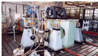
гидропривод в авиационной промышленности

Актуальность профиля «Автоматизированные гидравлические и пневматические системы и агрегаты»